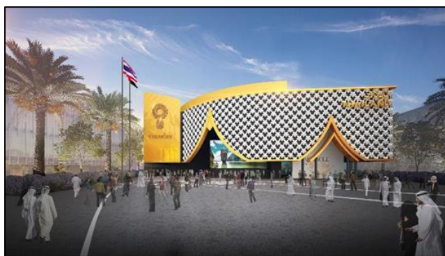
ภาพบรรยากาศพื้นที่อเนกประสงค์หน้าอาคารแสดงประเทศไทย