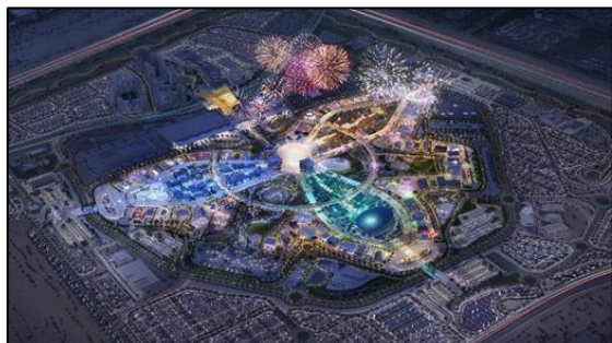
ภาพจำลองบรรยากาศ World Expo 2020 Dubai