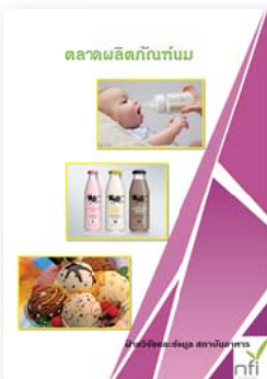
ซีดีตลาดผลิตภัณฑ์นม ปีที่พิมพ์ 2558 ราคา 250