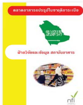
ซีดีตลาดอาหารแปรรูป ในซาอุดีอาระเบีย ปีที่พิมพ์ 2558 ราคา 350