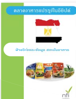
ซีดีตลาดอาหารแปรรูปในอียิปต์ ปีที่พิมพ์ 2558 ราคา 350