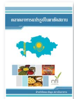
ซีดีตลาดอาหารแปรรูป ในคาซัคสถาน ปีที่พิมพ์ 2558 ราคา 350