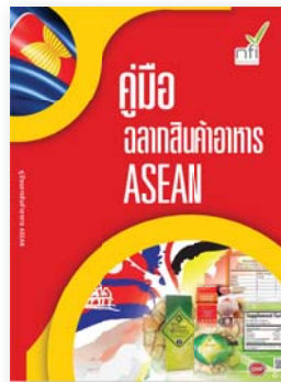
คู่มือฉลากสินค้าอาหาร ASEAN ปีที่พิมพ์ 2559 ราคา 350